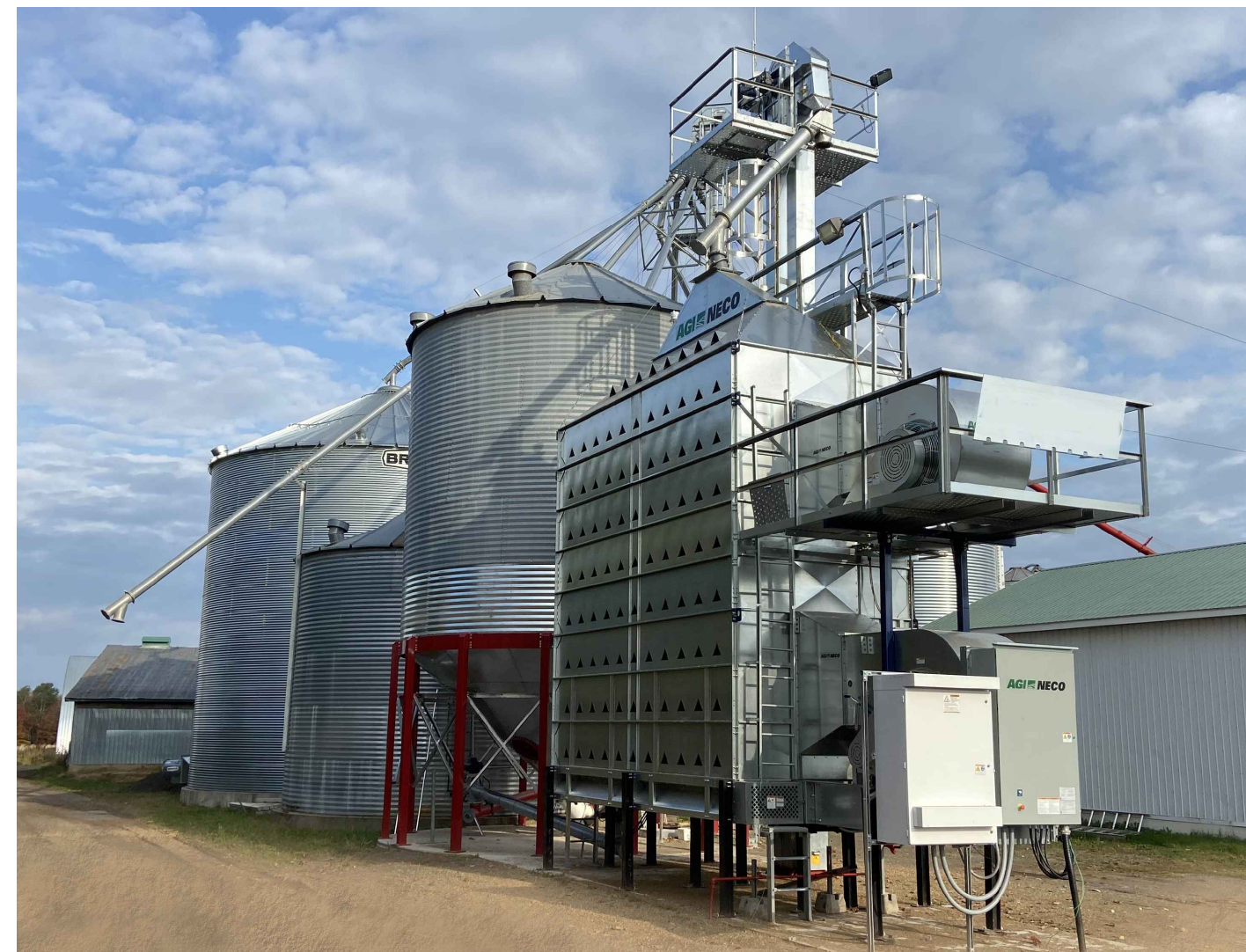
Modernisation ou achat d'une installation de séchage