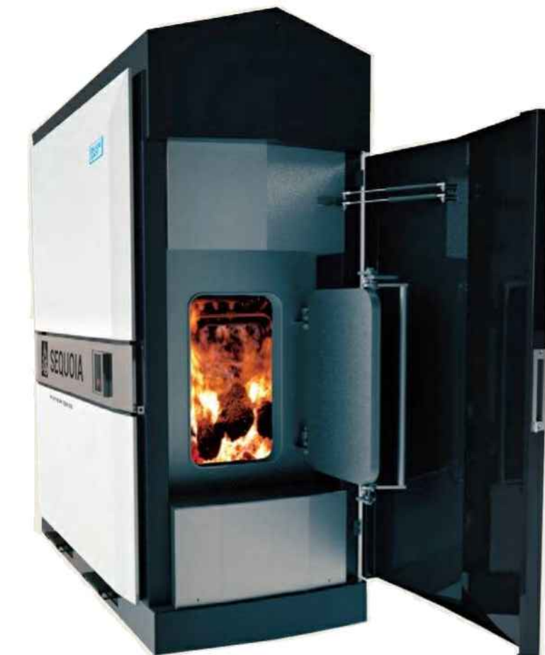
Installation de chaudière à la biomasse