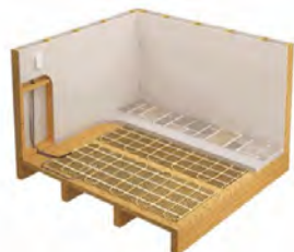
SÉRIE OWC-M (INSTALLÉ)