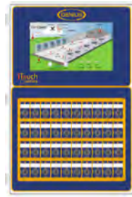
ITOUCH RÉGULATEUR INTÉLLIGENT MULTI ZONES