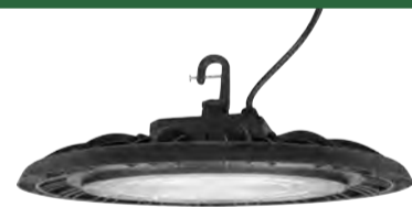
SUBVENTIONNÉ PAR Hydro Québec SPEC-LITE