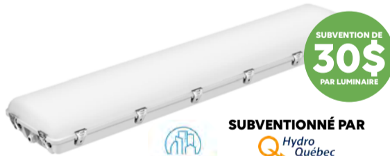
SUBVENTIONNÉ PAR Hydro Québec SPEC-LITE