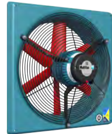
VENTILATEUR D'ÉVACUATION AVEC MOTEUR ÉCONERGÉTIQUE (240V)