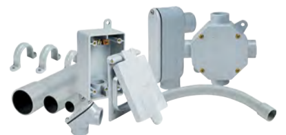
RACCORDS ET ACCESSOIRES ÉLECTRIQUES