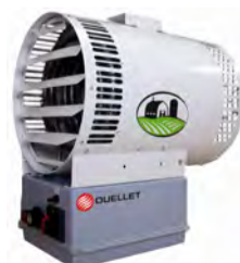
AÉROTHERME AGRICOLE LAVABLE