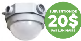
SUBVENTIONNÉ PAR Hydro Québec SPEC-LITE