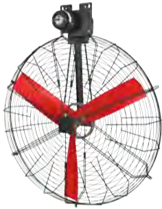
VENTILATEUR PANIER DE RECIRCULATION