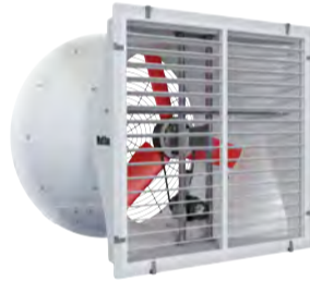
VENTILATEUR ENTRAÎNEMENT DIRECT (V-FAN M, 240V)